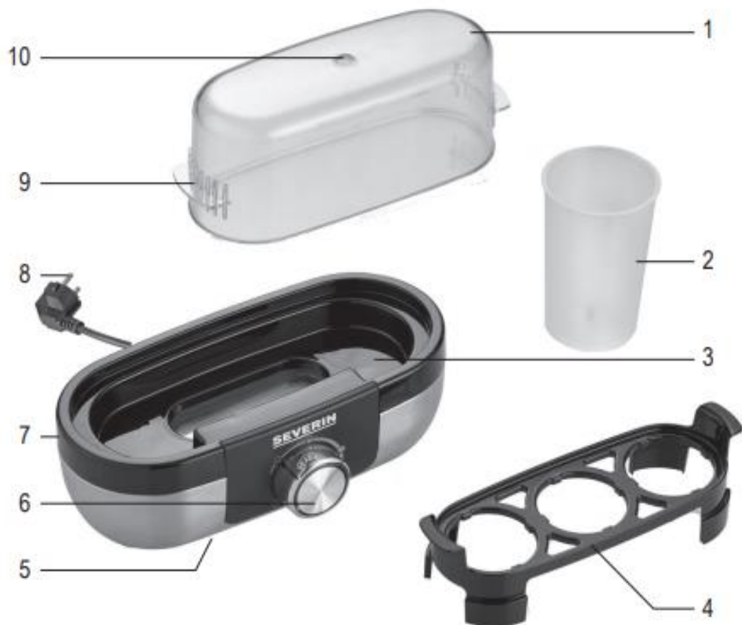
VAŘIČ VAJEC SEVERIN EK 3163