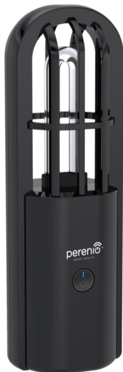
Obrázek 1 - Vzhled