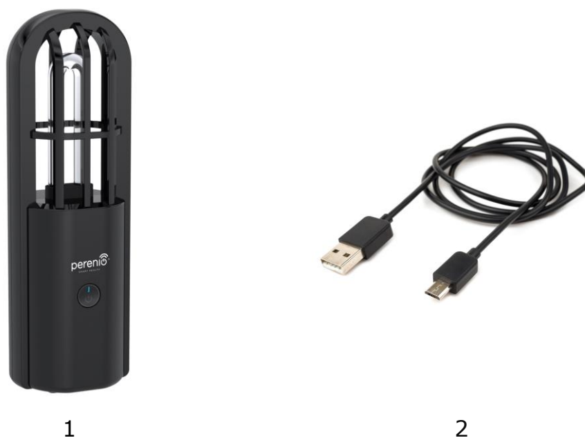
Obrázek 3 - Obsah dodávky*

* Obrázky komponent jsou pouze pro informační účely