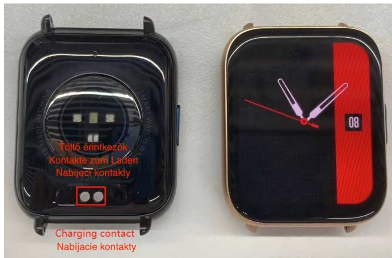
Schéma těla chytrých hodinek