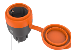
Przycisk wyłączenia/włączenia i kontrolka LED