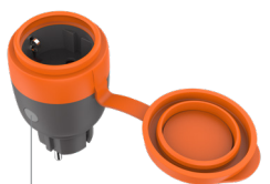
ON/OFF button and LED indicator light