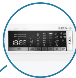
Ovládání pomocí elektronického displeje