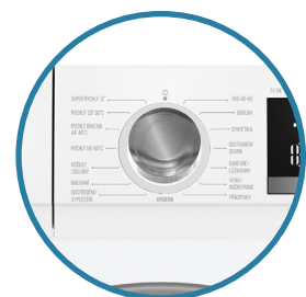
15 pracích programů s českými popisky na ovládacím panelu