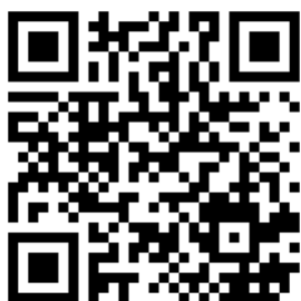
QR kód aplikace.

Tento symbol označuje jakou technologií byly hodinky lokalizovány, z čehož vyplývá i přesnost lokalizace. Hodinky vám poskytnou v co nejkratším čase informaci o poloze hodinek technologií, která jim jako první předá informaci o poloze, což je nejčastěji LBS, nebo WIFI a v případě, že jsou dostupné satelity GPS „otevřené prostranství“ se do několika desítek vteřin změny automaticky čas lokalizace a symbol „LBS, WIFI, GPS“ na ten, kdy nastala změna v přesnějším určení polohy. GPS.