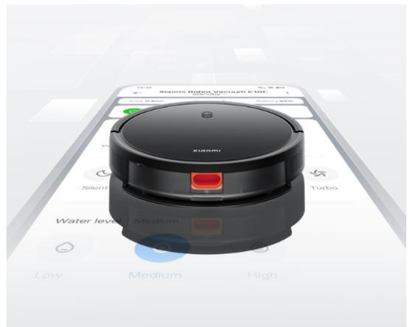
Ovládání prostřednictvím aplikace