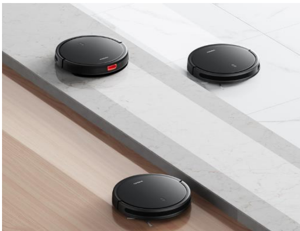
3 500 Pa sací výkon