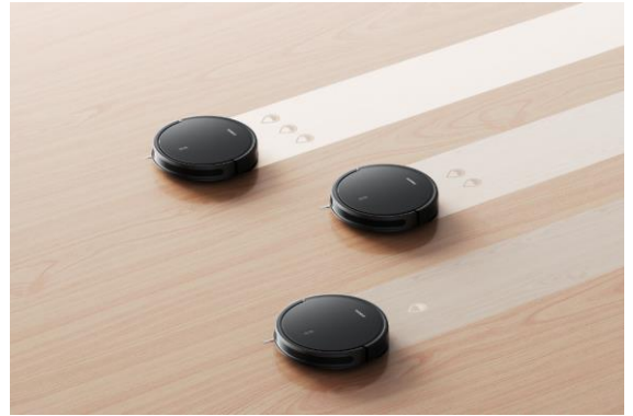
3 úrovně regulace vody