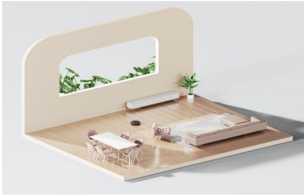
Inteligentní plánování trasy